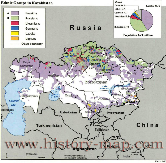
Harita 3.1.: Kazakistan'da Yaşayan Etnik Grupların Bölgelele Göre Dağılımı