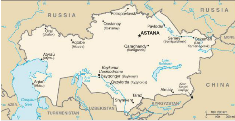
Harita 3.2: Kazakistan İdari Haritası