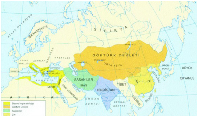
İslamiyet Öncesi Dünya Haritası ( http://www.tarhibilimi.gen.tr/makale/islamiyetin-dogusunda-dunyanin-durumu/1317/ )

İlk olarak, İran/Fars-Turan mücadelesi ve Sasani İran-Göktürkler rekabeti çok eski zamanlarda gerçekleşmiş ve artık halkın hafızasında canlılığını yitirmiştir. Üstelik son bin yıldır İran, Türklere yönetilmiş ve İran'da Türklere kalabalık bir nüfusa sahip olmuştur. Ayrıca Turan bölgesi olan Türkistan artık Rusya tarafından işgal edilmiş ve tehdit olarak Rusya, Turan'ı değiştirmiştir.