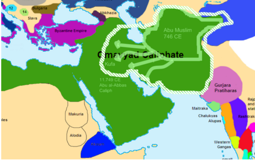
Abbasi-Emevi Karşılaşmasındaki İran'ın Abbasiler İçin Önemi Gösteren Harita

İslam dininin İran medeniyetiyle etkileşiminden söz ederken, İran'ın İslam medeniyetine olan katkısı göz önünde bulundurulmalıdır. Özellikle Abbasilerin, Emevileri devirerek İslam yönetimini ellerine almasında İran çok önemli rol oynamıştır. Nitekim İran, Abbasilerin güç kaynağı olmuştur. Bu sebeplerden dolayı İslam hilafetinin merkezi Şam'dan Bağdat'a taşınmıştır. Şam demek, Bizans demektir. Bağdat demek ise İran demektir. Bu süreçte İslam Devleti'nin Farslaşması gerçekleşmiştir.