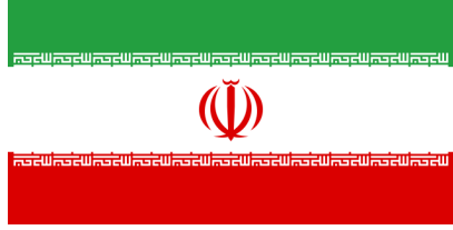
İran İslam Cumhuriyeti Ulusal Bayrağı

Bu bayraklar farklı yorumlanabilmektedir. Ancak sonuç itibarıyla iki halkın ortak algı ve dünya görüşünü paylaştıkları ileri sürülebilir. Ayrıca ortak algıyı, ortak dil ve ırkın yanı sıra; İslamiyet öncesindeki Zerdüştlük dini de oluşturmaktadır. İran dış politikasının Kürtlerle ilişkisi analiz edilirken bu ortak değerler jeokültürel kod olarak mutlaka devreye girecektir.