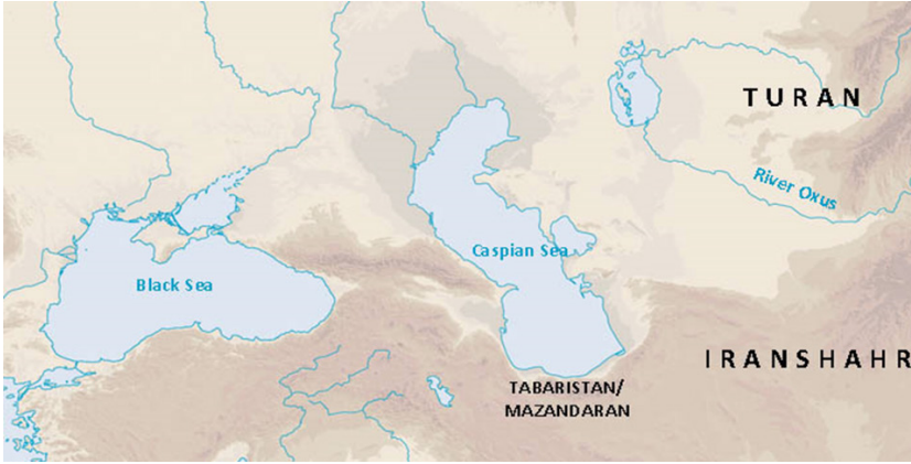
İran ve Turan

Halbuki Pehlevi Dönemi'ndeki İran'ın, Türklere karşı düşman bir söylem geliştirmedeği gözlemlenmektedir. Bunun birkaç sebebi vardır: