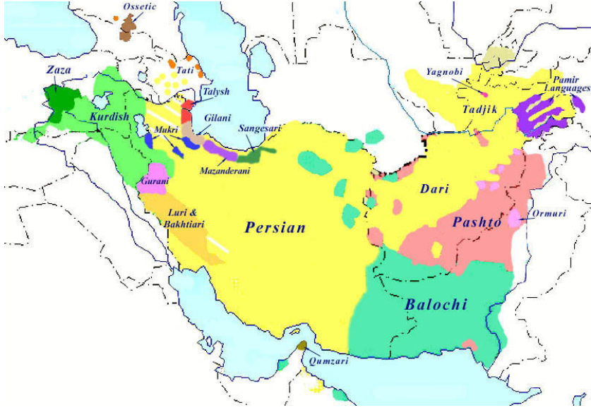
İran Dilleri Haritası

Bu anlamda İran'ın doğusundaki Tacikler ve batısındaki Kürtler İran/Fars Dünyası kapsamına girmektedirler. Ancak, tarihi olarak Tacikler Sünni Türkistan coğrafyasının parçasıydılar. Aynı şekilde Kürtler de Sünni kimliği baskın olan Osmanlı devletinin unsuruydu. Dolayısıyla, milli kimlik bağlamında kodlanan Tacikler ve Kürtlerin, dini kimlik boyutunda İran'ın Şii "ötekileri" bağlamında tartışılması daha uygundur.