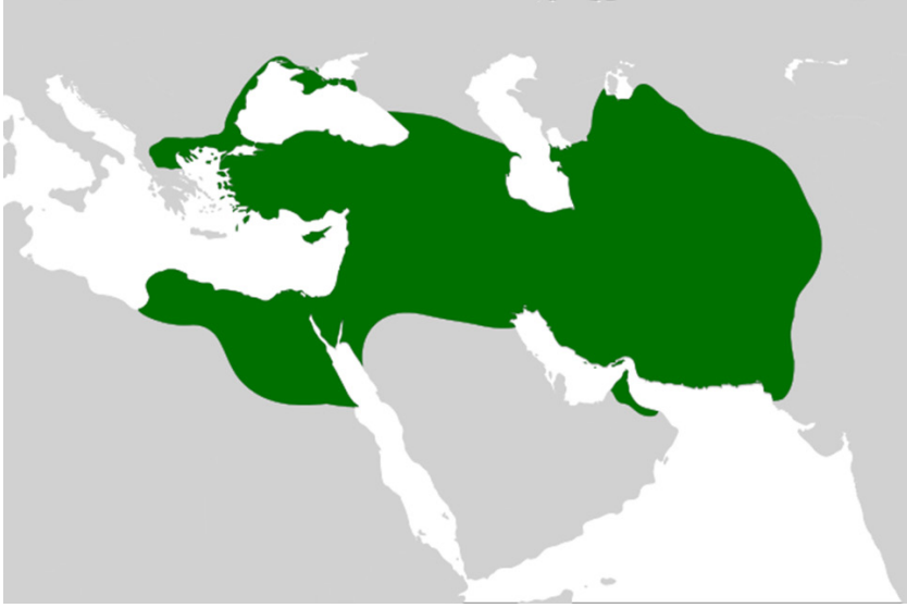
Darius I ve Xerxes I dönemindeki Ahameniş İmparatorluğu

düşünülmektedir. Belki de Orta Asya ile İran tarihine bütüncül bir bakış açısı ile bakmak gerekmektedir. Zira biri olmadan diğersinin tarihi hep eksik kalacaktır. Bu bakımdan Birleşmiş Milletler Eğitim, Bilim ve Kültür Örgütü'nün (UNESCO) himayesinde yazılan altı ciltlik Orta Asya Medeniyetler Tarihi adlı eser, bölge halklarının etkileşimini analiz eden en güzel örnektir.