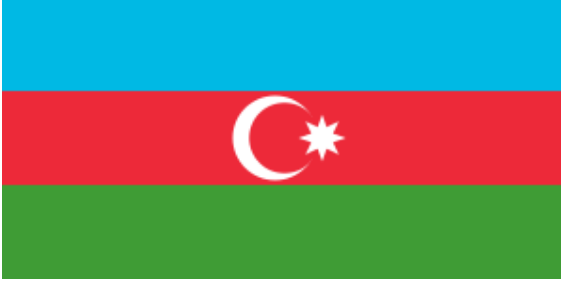
Azerbaycan Ulusal Bayrağı

Azerbaycan'a bu üçlü kimliği üzerinden bakıldığında; Azerbaycan'ın jeokültürel, jeopolitik ve jeoekonomik olarak bir ayağı İran'a demirlenmiş bir şekilde kalacaktır. Buna ek olarak, İran'daki Türk kökenli nüfus düşünülürse, iki ülke arasında aslında çok ciddi ortak değerler bulunmaktadır. İran şimdilik bu iki unsuru dış politika unsuru olarak kullanmamaktadır. Çünkü Azerbaycan kimliğinin diğer iki ayağı olan Türklük ve Avrupalılık daha ağır basmaktadır. Ancak yine de zamanla Azerbaycan toplumunun dindarlaşması ülke kimliğinin İslam boyutunu güçlendirebilir, bu da Azerbaycan'daki İran etkisini arttırabilecektir. Ya da tam tersine İran'ın olası bir demokratikleşme sürecine girdiği varsayılırsa, o zaman da Batı değerlerinden dolayı Azerbaycan-İran ilişkileri normalleşebilecektir.