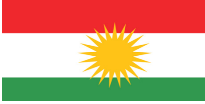
Irak Kürt Bölgesel Yönetimi Bayrağı