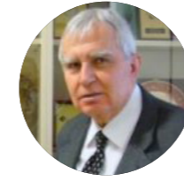
Murat BILHAN Посол в отставке

Отметив, что Россия проводит на Балканах важную политику идентификации, Эрен сказал, что Россия стремится усилить свое влияние в регионе, превратив неопределенность продолжающегося политического кризиса в Боснии и Герцеговине в возможность. Эрен сказал: «Развитие кризиса в Боснии и Герцеговине станет ясным после того, как США и ЕС предпримут шаги в отношении региона».